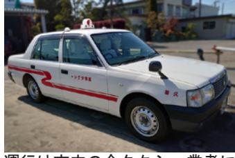
運行は市内の全タクシー業者に

ふれあいタクシー（補助タク）の運行を開始しました。この制度は、タクシー料金の一部を補助する制度で、福祉タクシー利用券との併用もできます。運行エリアは、乗車地から目的地までの距離が市内であれば利用できます。そのため、地域外への通院や移動が可能になります。事前には、登録申請が必要です。ご利用には、登録タクシー事業者に電話で予約し、乗車の際には利用登録証を提示します。17時～利用料金 月々土9時から5段階 600円