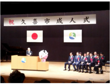
令和2年の成人式（菅蒲地区）催し。会場は、令和4年4月1日より成人年齢が18歳に引き下げられます。

久喜市の成人式対象年齢は、民法改正後も20才で開催することがわかりました。民法の改正により、令和4年4月1日より成人年齢が18歳に引き下げられます。また、現在4地区で開催している成人式は、未定です。